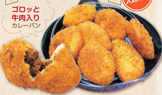
ゴロツと牛肉入りカレーパン