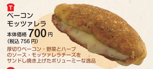
ベーコン モッツアレラ