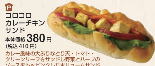
コロコロ カレーチキン サンド