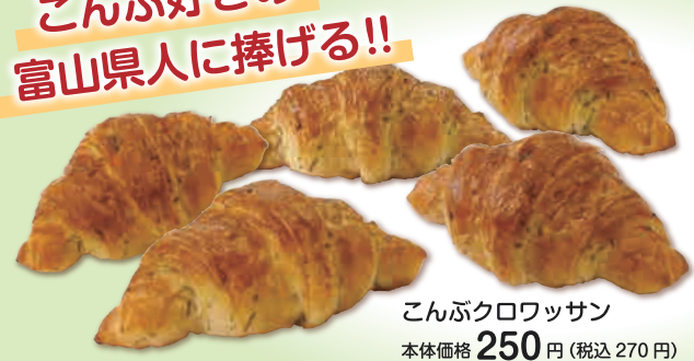
こんぶクロワッサン 本体価格 250円 (税込 270円)

何度も何種類も こんぶだしを取り 試行錯誤の末にたどり着いた クロワッサンの為の こんぶだしと刻みこんぶ入り こんぶの旨みとバター のkokoroが後をひく、 やみつきになる美味しさです