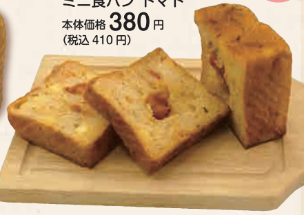
ミニ食パン トマト 本体価格 380円 (税込 410円)

贅沢を、ほおぼる。 ごちそうをパンで包みました。素材にこだわるワンランク上のプレミアムなパン