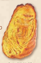
森の切り株 本体価格 250円 (税込 270円)