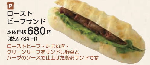
ロースト ビーフサンド