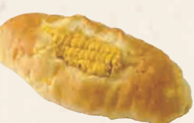
コーンパン 本体価格 350円 (税込 378円)