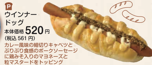
ウインナー ドッグ