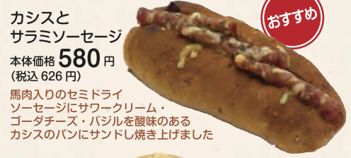
カシスとサラミソーセージ