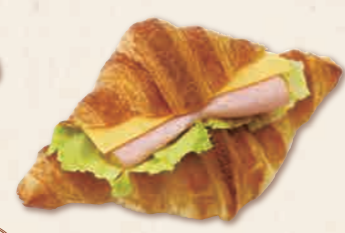
クロワッサンサンド 本体価格 360円 (税込 388円)