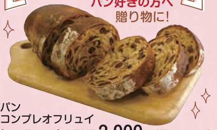
パン コンプレオフリーユ 【長さ:約23cm】 本体価格 2,000円 (税込 2,160円) 北海道産小麦全粒粉と北海道産小麦を使用した生地に洋酒漬けドライフルーツ、アーモンドを入れて焼き上げました。表面は固く焼き上げ中は柔らかく弾力のある食感が特徴です