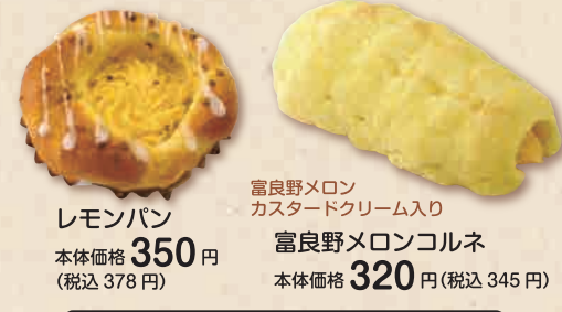
レモンパン 本体価格 350円 (税込 378円)