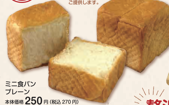
ミニ食パン プレーン 本体価格 250円 (税込 270円)

北海道産小麦「春よ恋」と「きたほなみ」をブレンドして使用。香ばしい香りとふわふわでもちもちとした食感が特徴です。 今回はお試しサイズでご提供します。