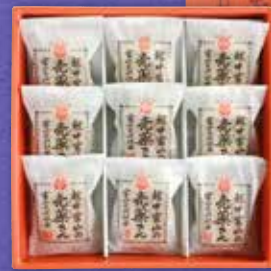
越中富山の売薬さん 詰合せ 【4個入】 [9個入]