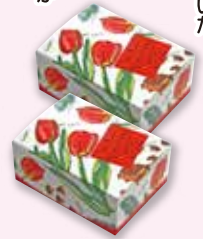
チューリップフラワーサブレ 詰合せ 【4枚入】 [8枚入]

富山の県花、チューリップを描いたかわいらしいサブレです。かわいらしい種類のお菓子、甘みと香ばしさがお口の中に広がります。