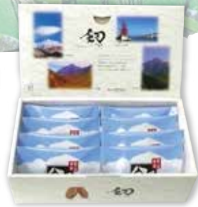
剣 詰合せ 【4枚入】 [8枚入]